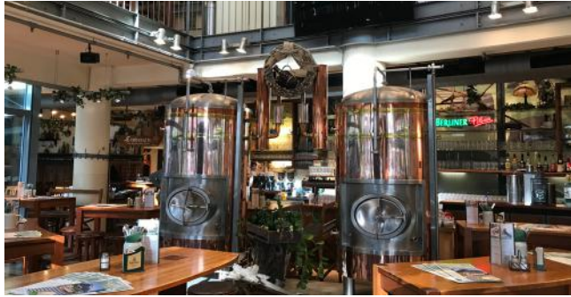
Erdgeschoss - Bierlobby: 90 Plätze