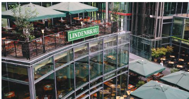
Dachterrasse: 88 Plätze