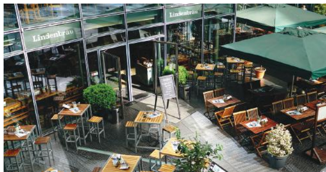
Biergarten: 228 Plätze