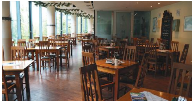
2. Obergeschoss: 180 Plätze