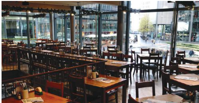
1. Obergeschoss - Panoramraum: 82 Plätze