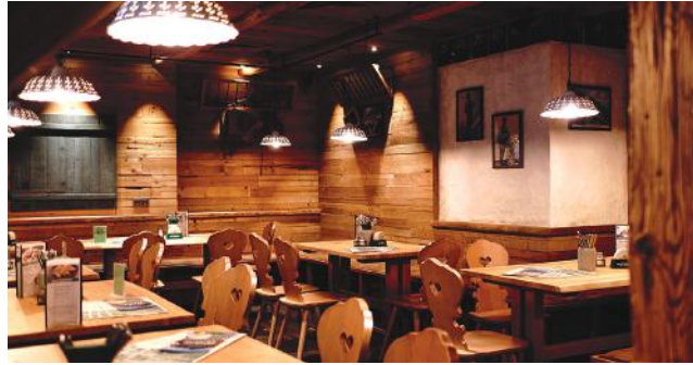
Erdgeschoss - Lindenalm: 75 Plätze